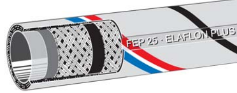
Form D ohne Wendel Form D without helix